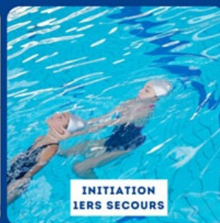
INITIATION IERS SECOURS