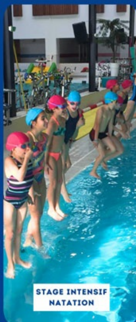
STAGE INTENSIF NATATION